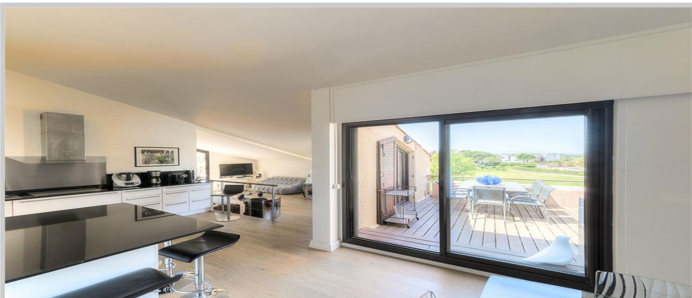
APPARTEMENT PENTHOUSE SUR GOLF, SAINT CYPRIEN